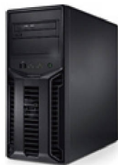
データサーバー サーバーに情報を蓄積

ベッドのそば、病室等、 ネットワークのない場所でも 場所を選ばず持ち歩き 患者様の情報入力が行えます。